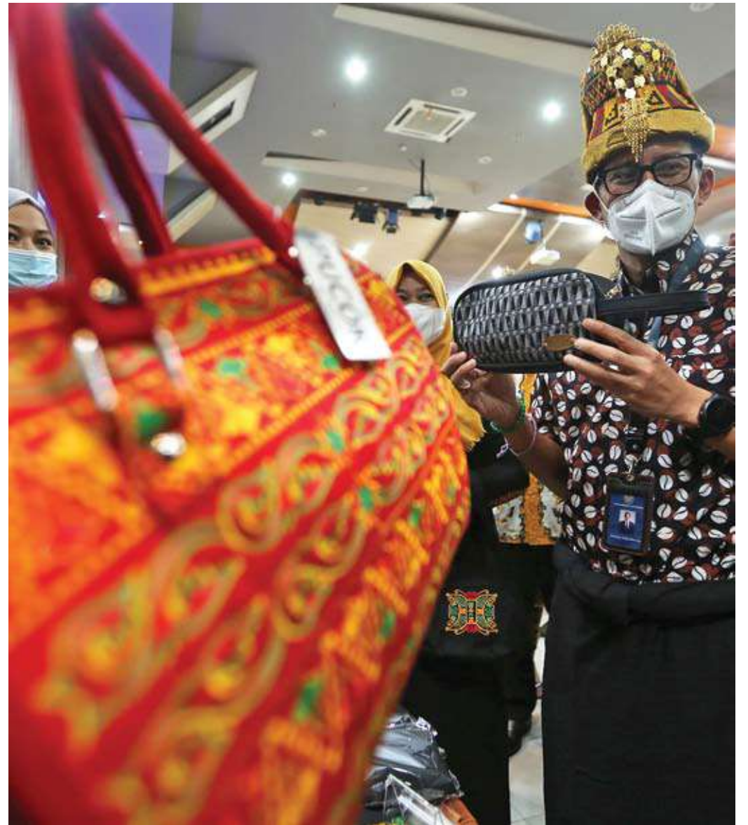
MEMBANGKITKAN UMKM DI TENGAH PANDEMI: Menteri Pariwisata dan Ekonomi Kreatif (Menparekraf) Sandiaga Uno melihat hasil kerajinan usaha mikro, kecil dan menengah (UMKM) di Banda Aceh, Aceh, kemarin. Menparekraf berharap UMKM di Aceh dapat kembali bangkit guna membangkitkan kembali sektor pariwisata dan ekonomi kreatif di tengah pandemi covid-19.

“Terkait kinerja keuangan, pelambatan bisnis di KB Bukopin pun tidak bisa dihindari karena dampak pandemi covid-19. Restrukturisasi kredit tercatat mencapai Rp24 triliun, sekitar 30% dari total kredit yang disalurkan bank,” papar Presiden Direktur KB Bukopin Rivan Purwantono dalam rilisnya kemarin. (E-1)